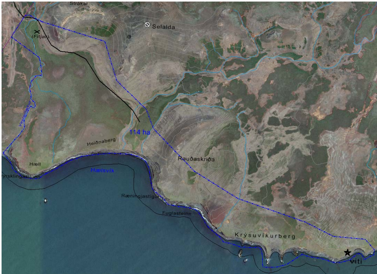
Mynd 1. Deiliskipulagssvæðið.

Aðkoma að svæðinu er af Suðurstrandarvegi (nr. 427) eftir Hælsvíkurvegi sem er í dag ónúmeraður malarvegur. Krýsuvíkurvegur (nr. 42) er tengivegur frá Hafnarfirði að Suðurstrandarvegi (nr. 427). Aukin umferð um svæðið kallar á uppbyggingu bílastæða, göngustíga, upplýsingaskilta og salerna. Innan deiliskipulagssvæðisins er ætlað að gera ráð fyrir ca. 40 nýjum bílastæðum og 5 rútustæðum. Gera á nýjar gönguleiðir og laga og endurbæta þær sem fyrir eru. Leggja á áherslu á aðgengi fyrir alla að hluta svæðisins þar sem stígar verða skilgreindir nægilega breiðir fyrir hjólastóla. Í bröttum hlíðum er þó nauðsynlegt að setja þrep. Innan svæðisins verða útsýnispallar, vegvísar og upplýsingaskilti með fróðleik um svæðið, jarðsögu þess, náttúrufrýrbæri og dýralíf.